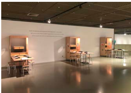
De ABC Museummodule in het KMSKB in Brussel.

van een werktafel die op de hoogte van kinderen van zes tot twaalf of voor volwassenen geïnstalleerd kan worden, een stopcontact en indirecte verlichting, een magneet- of prikbord, alsook een A3- en twee A4-dozen voor werkmateriaal. De module is licht geconcipieerd. Hierdoor kan ze door één persoon vervoerd en opgesteld worden.