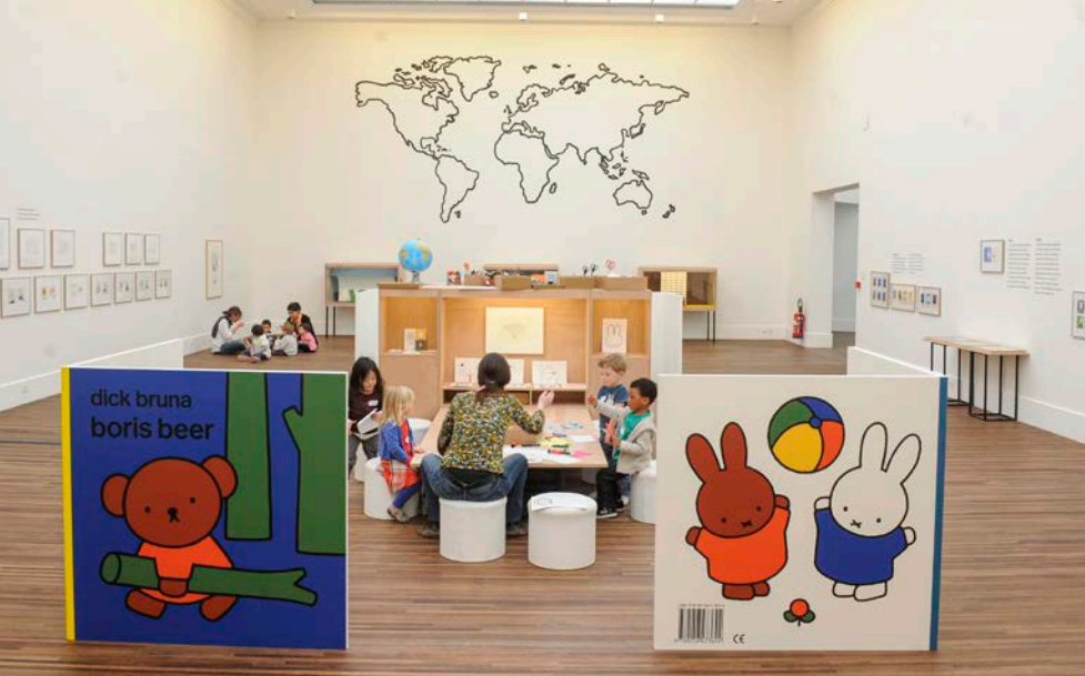
Expo over Dick Bruna