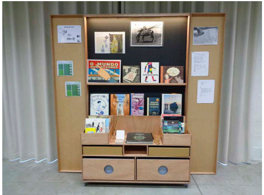
De Research Module van ABC.

Een ander meubel is de mobiele museummodule op wieltjes. Die is op maat van een standaard personen- of goederenlift ontworpen en kan overal in het midden van tentoonstellingsruimtes als educatief werkinstrument (voor zeven personen) ingezet worden. De buitenkant kan als visuele communicatiedrager voor exposities gebruikt worden en de module kan na het ontplooiën als workshop-eiland dienstdoen. Geïntegreerd in de module zijn zeven taboeretten en een metalen kader ter ondersteuning