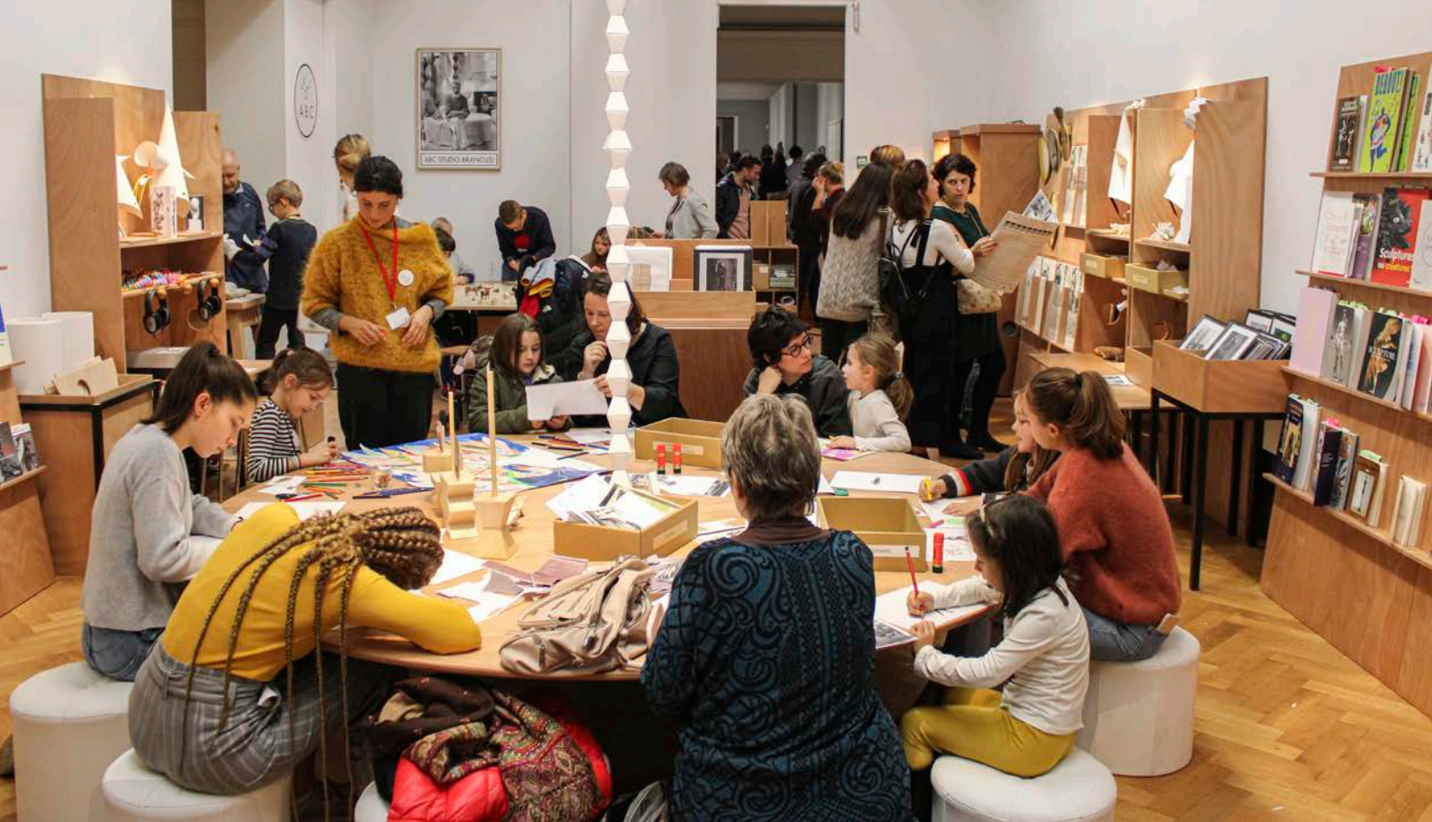
De ABC-Studio in BOZAR (Brussel), bij de expo over de kunstenaar Brancusi